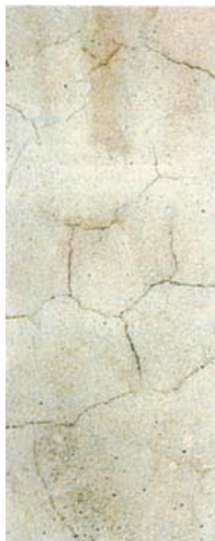
Nella foto: la formazione di cavillature di un prodotto tradizionale a base di legante sintetico.

La formulazione a base di Legante Minerale e la corretta e bilanciata distribuzione granulometrica (ad arco granulometrico continuo), evitano ritiri e quindi formazione di cavillature.