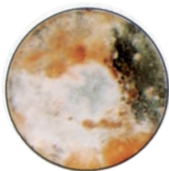
Un prodotto tradizionale.