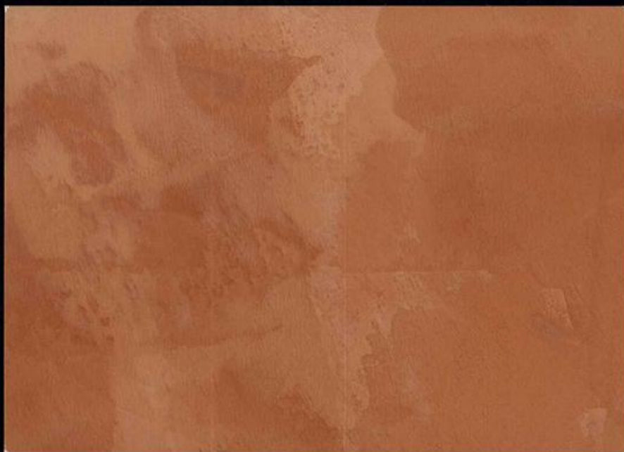
Spatolato a Calce Formula Standard - Rosa Lacca