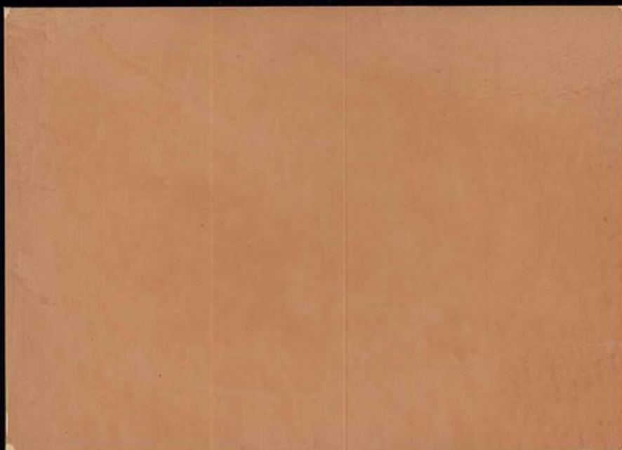
Spatolato a Calce Formula Lucida - Rosa Lacca